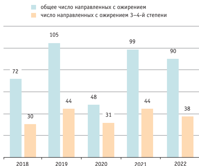
Fig. 2. Number of children with stage 3–4 obesity among all subjects with obesity referred to the City Centre for Endocrine and Metabolic Disorders located in the State Budgetary Healthcare Institution of the Novosibirsk Region 'Children's City Clinical Hospital No. 1', n

ций, в основном за счет детей с ожирением 1-й и 2-й степени, в условиях пандемии новой коронавирусной инфекции.