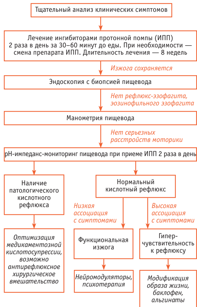
Fig. 2. Management of patients with refractory gastroesophageal reflux disease [15]

для лечения ГЭРБ магнитная сфинктерная аугментация [37]. На рисунке 2 приведен современный алгоритм ведения пациентов с рефрактерной ГЭРБ [15].