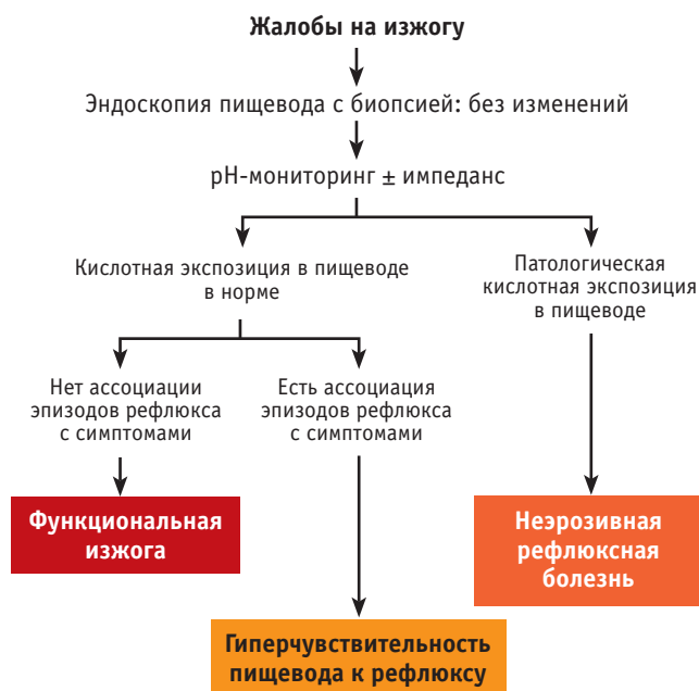
Рис. 1. Алгоритм дифференциальной диагностики функциональной изжоги, неэрозивной рефлюксной болезни и гиперчувствительности к рефлюксу [17] Fig. 1. Algorithm of differential diagnostics of functional heartburn, NERD and reflux hypersensitivity [17]

Анализ данных рандомизированных исследований показал, что прием ИПП 2 раза в день превосходит терапию двойной дозой ИПП 1 раз в день в поддержании рН желудка выше 4 в течение 24-часового мониторинга [22].